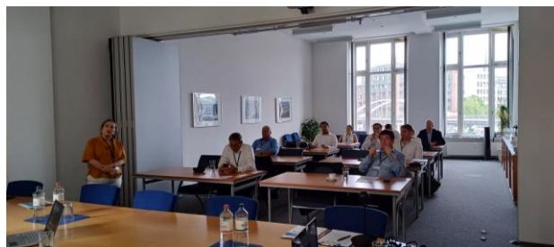
Impressionen einer von SBS organisierten Informationsveranstaltung in Hamburg

Eine Übersicht zu weiteren Projekten des Markterschließungsprogramms für KMU des Bundesministeriums für Wirtschaft und Klimaschutz können Sie unter www.gtai.de/mep abrufen.