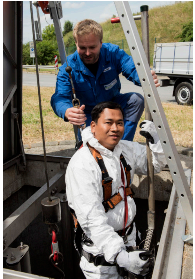
Đào tạo nâng cao cho nhà giáo và cán bộ đào tạo tại doanh nghiệp

Bên cạnh chương trình đào tạo nghề ban đầu, hoạt động của chương trình cũng tập trung cung cấp đào tạo ngắn hạn dành cho nhân viên kỹ thuật đang làm việc tại các doanh nghiệp thoát nước. Được sự đồng thuận của các doanh nghiệp thành viên, Hội Cấp thoát nước Việt Nam là cơ quan đầu mối cung cấp các chương trình đào tạo ngắn hạn chất lượng cao dựa trên nhu cầu của doanh nghiệp. Hội đã chứng nhận cho 24 cán bộ đào tạo tại doanh nghiệp và 10 giám khảo được đào tạo bởi Chương trình “Đổi mới Đào tạo nghề Việt Nam”. Đến tháng 8 năm 2019, Hội đã hoàn tất việc xây dựng 4 khoá đào tạo ngắn hạn và đào tạo được khoảng 550 công nhân lành nghề đang làm việc trong ngành thoát và xử lý nước thải.